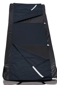
Vario Cover - L2E 200x88