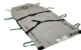
Art nr. 200-5039 B-Flo39