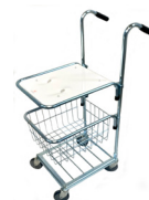
Art nr. 200-5100 B-Flo Wagon