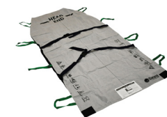
Art nr. 200-5034 B-Flo34