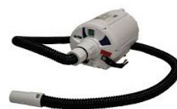
Art nr. 200-5010 B-FloPump