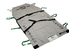
Art nr. 200-5034 B-Flo34