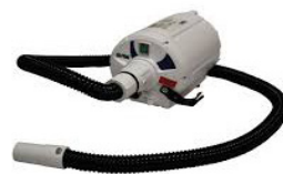
Art nr. 200-5010 B-FloPump