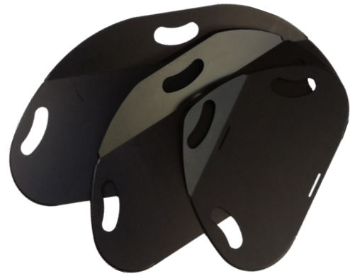
Master Glide Flexi