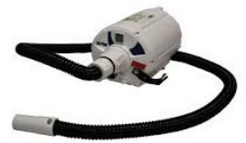
Art nr. 200-5010 B-FloPump