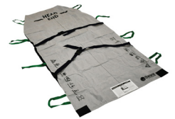
Art nr. 200-5034 B-Flo34