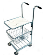
Art nr. 200-5100 B-Flo Wagon