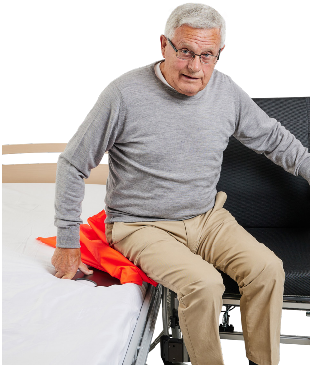
Lääkintälaitedirektiivi 2017/745 luokka 1