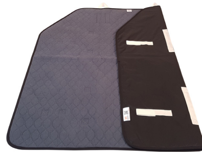
Master Turner Frotté Inco