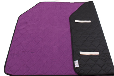
Master Turner Frotté