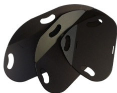
Master Glide Flexi