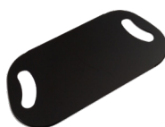
Master Glide Junior