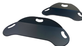
Master Glide Viking