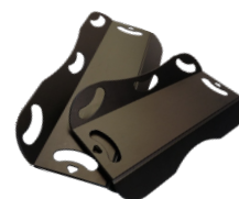
Master Glide Multi