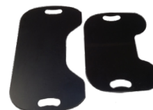
Master Glide Senior